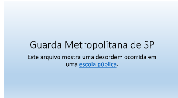
Figura 2: slide apresentado por Bárbara

Bárbara está preparando uma apresentação no MS PowerPoint 2010 para sua equipe e deparou com informações que gostaria de inserir para que ficassem disponíveis e sincronizadas com a internet de forma online , com o intuito de mostrá-las quando fosse clicada no texto escola pública, conforme a figura 2.