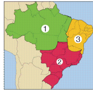
Mapa de divisão Geoeconômica.