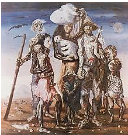
“Os Retirantes”. Cândido Portinari (1944)