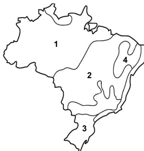
Tipos de clima no Brasil

Relacione os números indicados no mapa com os tipos de clima no Brasil e, assinale a alternativa incorreta .