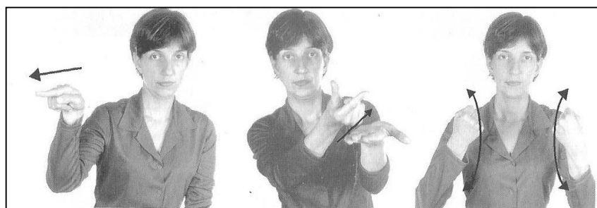
(Quadros & Karnopp, p. 40.)

No sistema de transcrição de sinais, as formas pronominais são transcritas utilizando a palavra relacionada ao pronome no português, definindo o gênero de acordo com o contexto, pois não há marcação morfológica de gênero.