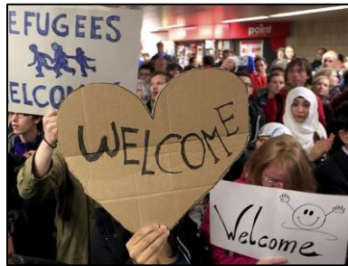
Grupo de refugiados é recebido com faixas de boas-vindas em estação ferroviária da Alemanha.

País abriu fronteiras para receber imigrantes de países em crise. Entre sábado e domingo, foram mais de 13 mil pessoas transportadas.