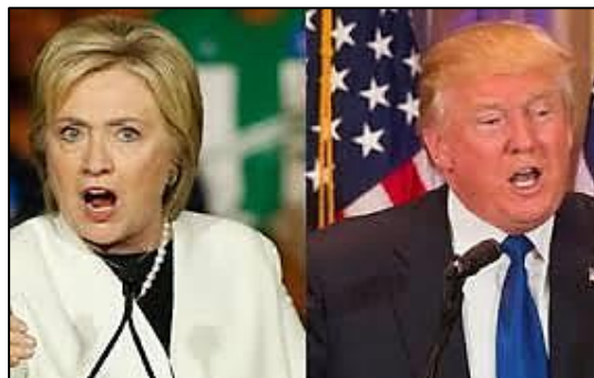
(Disponível em: http://www.emtempo.com.br/tags/donald-trump/ .)

“Após dois mandatos, Barack Obama não poderá concorrer a mais uma prolongação de sua estadia na Casa Branca em 2016. Acontecendo tradicionalmente na primeira terça-feira de novembro, as eleições presidenciais americanas têm sido, desde 1856, dominadas por dois grandes partidos. Segundo o think-thank apartidário PEW Research Center, a população americana vive uma onda crescente de partidarização. O mesmo pode ser dito nas outras esferas federais da política: tanto a Câmara do Senado quanto a dos Representantes, que compõem o Congresso americano, vivem um momento de polarização como não visto desde o final do século XIX.”