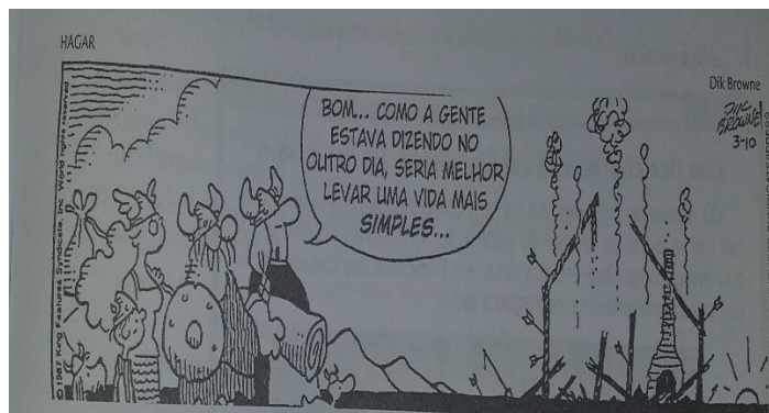
(BROWNE, Dik. O melhor de Hagar, o horrível 8. Porto Alegre L & PM, 2018 p. 70)

12- A expressão dos personagens da tirinha pode ser definida pelo sentimento de: