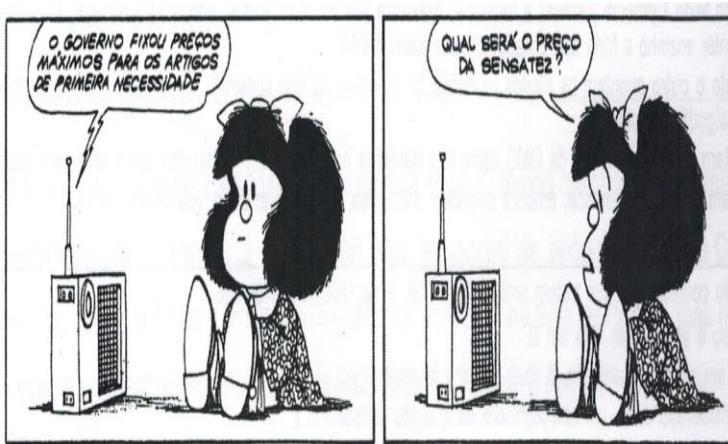
LAVAUU, Joaquin Salvador (QUINO). Toda Matalada . São Paulo: Martins Fontes, 2000. p. 341.

PARA RESPONDER À QUESTÃO 15, OBSERVE A TIRINHA ABAIXO: