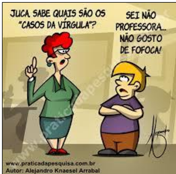
(Prática da Pesquisa. Julho de 2014.)

Observe na tirinha a fala da professora e do aluno.