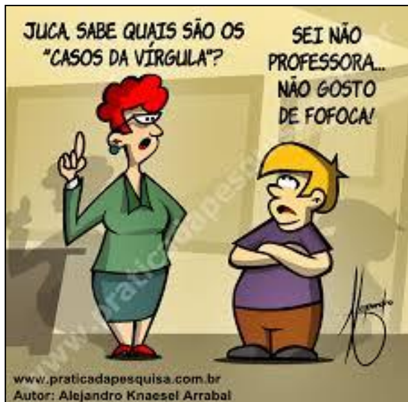
(Prática da Pesquisa. Julho de 2014.)

Observe na tirinha a fala da professora e do aluno.