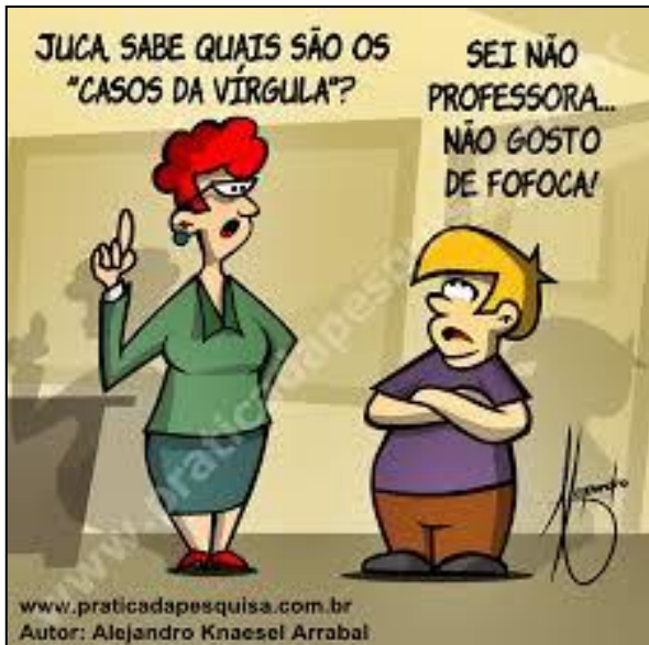
(Prática da Pesquisa. Julho de 2014.)

Observe na tirinha a fala da professora e do aluno.