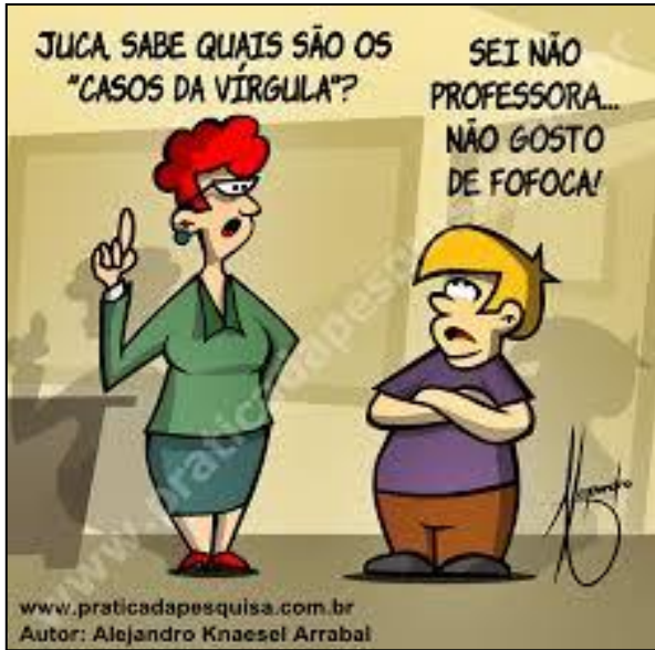
(Prática da Pesquisa. Julho de 2014.)

Observe na tirinha a fala da professora e do aluno.