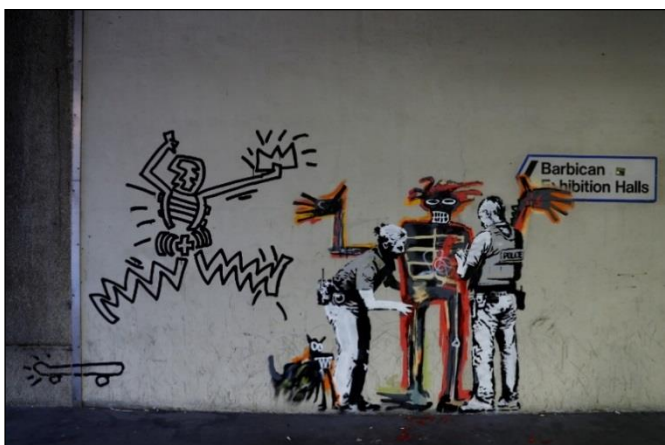
(Mural pintado por Banksy em Londres: a 1ª grande mostra de Basquiat no Reino Unido.)

Observe o grafite produzido pelo artista britânico Banksy , no qual presta homenagem a Jean-Michel Basquiat .