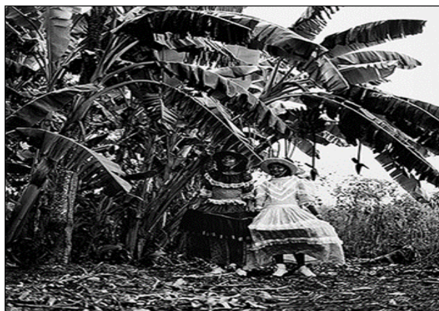
Série Festa Maracatu-rural. Walter Firmo. Fotografia.

(Disponíveis em: http://enciclopedia.itaucultural.org.br/obra20328/praiagrande-e-senzala )