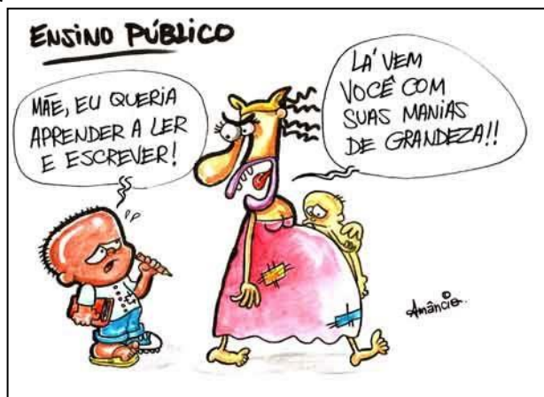
(Disponível em: http://www.futuroprofessor.com.br/wp-content/uploads/2009/03/ensino-publica-charge-de-amancio.jpg )

A charge de Amâncio relata a realidade de muitas crianças e adolescentes brasileiros. Em que pese o intuito do legislador, que destinou a proteção do ECA sem distinções entre as crianças e adolescentes, “sem discriminação de nascimento, situação familiar, idade, sexo, raça, etnia ou cor, religião ou crença, deficiência, condição pessoal de desenvolvimento e aprendizagem, condição econômica, ambiente social, região e local de moradia ou outra condição que diferencie as pessoas, as famílias ou a comunidade em que vivem (Art. 3º)”, nosso país ainda está distante de conseguir alcançar tal objetivo. Em relação à regulamentação do ECA sobre o direito da criança e do adolescente, especialmente no que se refere à educação, assinale a alternativa correta.