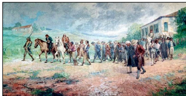
“Jornada dos Mártires” – Antônio Parreiras.

De acordo com o contexto histórico, é correto afirmar que a imagem anterior – representação de um momento que ilustra a Conjuração Mineira – faz parte de um momento da Literatura brasileira que: