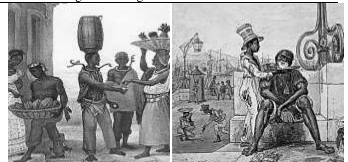
“Castigo imposto aos negros”, aquarela sobre papel, 22 x 14,5 cm, J.B. Debret, Rio de Janeiro, c.1816-1831.