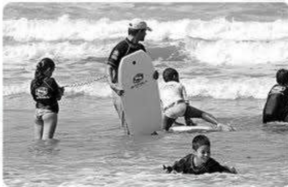
No contato com a água, alunos entre quatro e 12 anos, desenvolvem habilidades e maior autoestima.