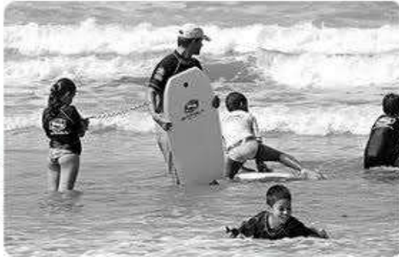
No contato com o água, alunos entre quatro e 12 anos, desenvolvem habilidades e maior autoestima.