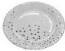
Prato: Circunferência = 61,23cm

Considerando \pi = 3,14 podemos concluir que o comprimento aproximado da circunferência da lata de doce e a medida do diâmetro do prato são respectivamente de: