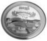
Lata de Doce: Diâmetro = 15,5cm