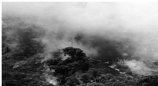
Árvores são queimadas na Amazônia para a atividade agrícola

RIO — O cientista Antônio Pereira Nobre, pesquisador do Instituto Nacional de Pesquisas Espaciais (Inpe), lançou anteontem o estudo “O Futuro Climático da Amazônia”, no qual relaciona a seca no Sudeste ao desmatamento.