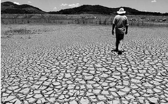
A gestão da água não construiu um sistema interligado que equilibrasse demanda e estoque