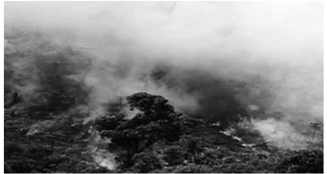
Árvores são queimadas na Amazônia para a atividade agrícola

RIO — O cientista Antônio Pereira Nobre, pesquisador do Instituto Nacional de Pesquisas Espaciais (Inpe), lançou anteontem o estudo “O Futuro Climático da Amazônia”, no qual relaciona a seca no Sudeste ao desmatamento.