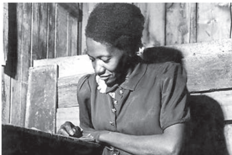
Carolina Maria de Jesus

“[...] em 1948, quando começaram a demolir as casas térreas para construir os edifícios, nós, os pobres que residíamos nas habitações coletivas, fomos despejados e ficamos residindo debaixo das pontes. É por isso que eu denomino que a favela é o quarto de despejo de uma cidade. Nós, os pobres, somos os trastes velhos. [...]” “[...] Eu classifico São Paulo assim: o Palácio é a sala de visita, a Prefeitura é a sala de jantar e a cidade é o seu jardim. A favela é o quintal onde jogam os lixos. [...]” “Quando estou na cidade, tenho a impressão que estou na sala de visita, com seus lustres de cristais, seus tapetes de veludo, almofadas de cetim. E quando estou na favela, tenho a impressão que sou um objeto fora de uso, digno de estar num quarto de despejo.” “[...] nós somos pobres, viemos para as margens do rio. As margens do rio são os lugares do lixo e dos marginais. Gente da favela é considerada marginal. Não mais se vê os corvos voando às margens dos rios, perto dos lixos. Os homens desempregados substituíram os corvos.” “Os políticos sabem que eu sou poetisa. E que o poeta enfrenta a morte quando vê o seu povo oprimido.” “O Brasil devia ser dirigido por quem passou fome.” “Não digam que fui rebotinho, que vivi à margem da vida. Digam que eu procurava trabalho, mas fui sempre preterida. Digam ao povo brasileiro que