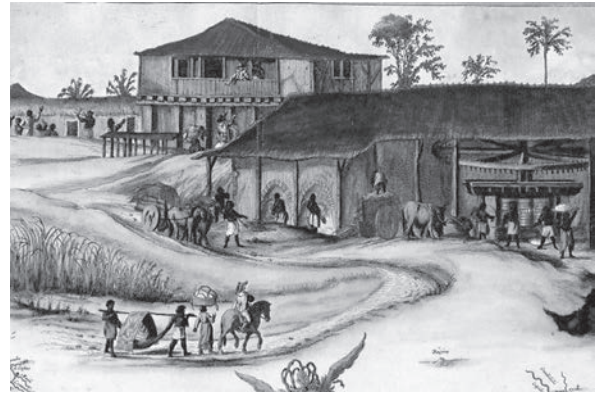
Fragmento da gravura “Engenho de Itamaracá” - Frans Post

“Desde a transição democrática de meados dos anos 80, o povo brasileiro contempla, entre perplexo e cada vez mais desencantado, o espetáculo da mudança sem esperança ou, como dizia um crítico de Adorno, ‘a realização das esperanças do passado’. Assim os senhores da terra concebem o progresso. As eleições diretas sucumbiram diante do Colégio Eleitoral. A nau de Ulysses encalhou nas praias do transformismo e os naufragos do regime militar saltaram alegremente para bordo. Na eleição de 1989, o Caçador de Marajás saiu do quase anonimato para ser promovido como mercadoria nova, produzida nas retortas dos marqueteiros e exposta nas vitrines da mídia de resultados, sob os aplausos e a chuva de grana despejada pelo patriciado nativo.