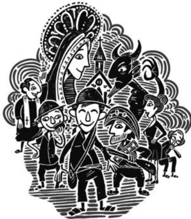
Xilogravura de Ricardo Mapurunga | Paraíba, Piauí.