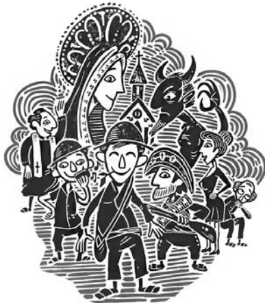
Xilogravura de Ricardo Mapurunga | Paraíba, Piauí.