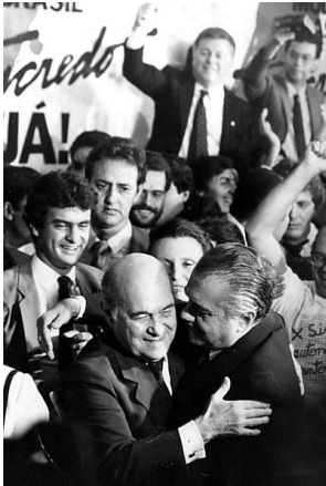
Após a vitória, Tancredo Neves recebe os cumprimentos de José Sarney e correligionários no Congresso Nacional

Em 2015 o Brasil comemora 30 anos do início da Redemocratização. Sobre esse período da história brasileira, é correto afirmar que: