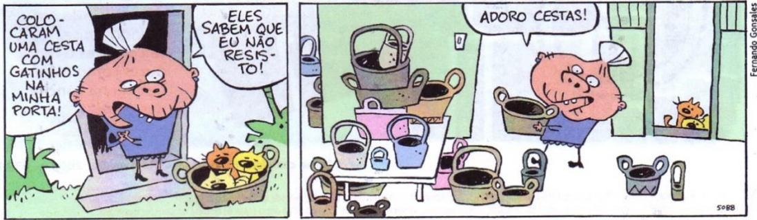
(Fernando Gonsales. Níquel Náusea – A vaca foi pro brejo atrás do carro na frente dos bois. São Paulo: Devir, 2010. p. 38.)

O sujeito é o termo da oração com o qual o verbo mantém concordância e sobre o qual o predicado enuncia algo – definição mais abrangente que a tradicional “termo que pratica a ação do verbo”. Na tirinha, esse termo aparece de maneiras diferentes. Assim, assinale a alternativa CORRETA .