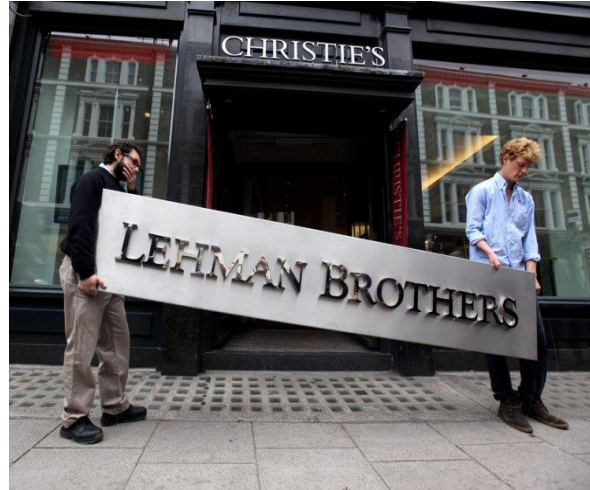
Paul Krugman (org.). A crise de 2008 e a economia da depressão . Rio de Janeiro, Campus, 2009.