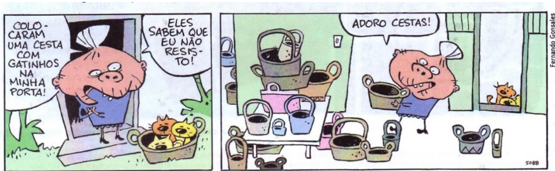
(Fernando Gonsales. Níquel Náusea – A vaca foi pro brejo atrás do carro na frente dos bois. São Paulo: Devir, 2010. p. 38.)

O sujeito é o termo da oração com o qual o verbo mantém concordância e sobre o qual o predicado enuncia algo – definição mais abrangente que a tradicional “termo que pratica a ação do verbo”. Na tirinha, esse termo aparece de maneiras diferentes. Assim, assinale a alternativa CORRETA .