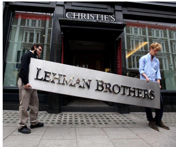
Paul Krugman (org.). A crise de 2008 e a economia da depressão . Rio de Janeiro, Campus, 2009.

17. A imagem abaixo reproduzida representa a grande crise financeira de 2008, cujo símbolo foi a falência do banco norte-americano Lehman Brothers. Uma das consequências desse episódio foi uma crise generalizada no sistema financeiro e bancário internacional, levando o mundo à maior recessão observada desde a década de 1930. Assinale a alternativa que resume corretamente as principais causas da crise de 2008.