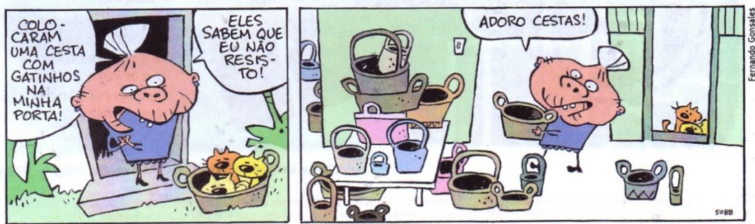
(Fernando Gonsales. Níquel Nôusea – A vaca foi pro brejo atrás do carro na frente dos bois. São Paulo: Devir, 2010. p. 38.)

O sujeito é o termo da oração com o qual o verbo mantém concordância e sobre o qual o predicado enuncia algo – definição mais abrangente que a tradicional “termo que pratica a ação do verbo”. Na tirinha, esse termo aparece de maneiras diferentes. Assim, assinale a alternativa CORRETA .