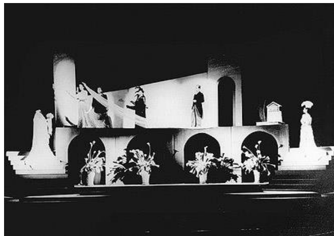
Vestido de Noiva , de 1943.

Internet: < https://enciclopedia.itaucultural.org.br >.