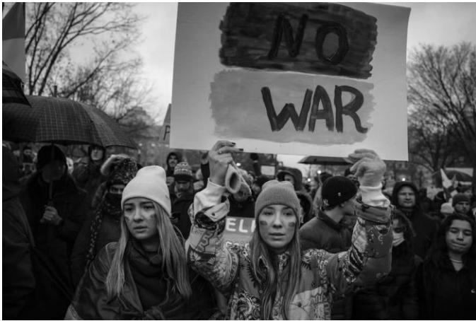
Manifestantes protestam contra a operação militar da Rússia na Ucrânia no Lafayette Park, em Washington

Milhares de pessoas tomaram as ruas de Nova York, Madri, Berlim, Paris, Varsóvia, Haia e da própria Rússia nesta quinta-feira (24), para exigir que o presidente russo, Vladimir Putin, dê fim à “loucura” da guerra que desencadeou com a invasão à Ucrânia, que já deixa centenas de mortos e dezenas de milhares de deslocados.