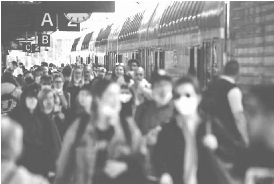
Pfingstwochenende mit dem 9-Euro-Ticket - volle Bahnsteige Sonntag, 12.06.2022, 09:15.

1 Das 9-Euro-Ticket ist derzeit in aller Munde. Seit dem 1. Juni können Passagiere für neun Euro den Nahverkehr in ganz Deutschland nutzen. Die Meinungen, ob diese Entlastungen wirklich sinnvoll sind, gehen auseinander. In FOCUS-Online-Redaktion wird kontrovers diskutiert.