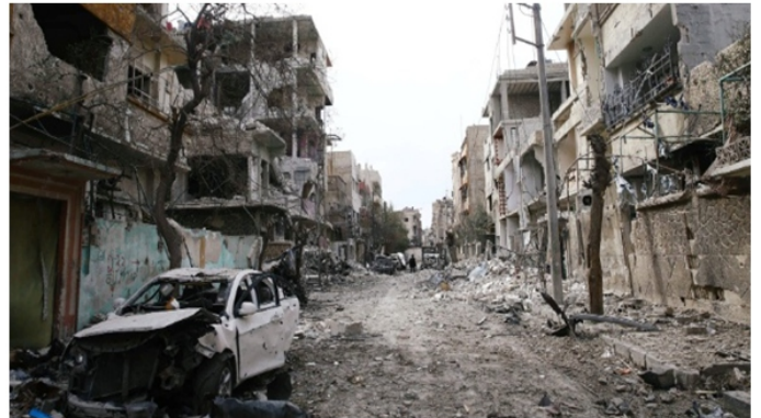
Imagem: Bassam Khabieh/ Reuters.

(Extraído de: https://www.marilia.unesp.br/Home/Extensao/observatoriodeconflitosinternacionais/serie---a-guerra-civil-na-siria---atores-interesses-e-desdobramentos.pdf )