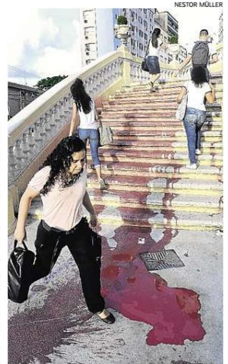
Quem passou pelo local ficou chocado com o “sangue”

O evento teve, também, a simulação de um parto e uma espécie de tribunal popular, para debater violência contra mulheres nos hospitais. (Leonardo Soares)