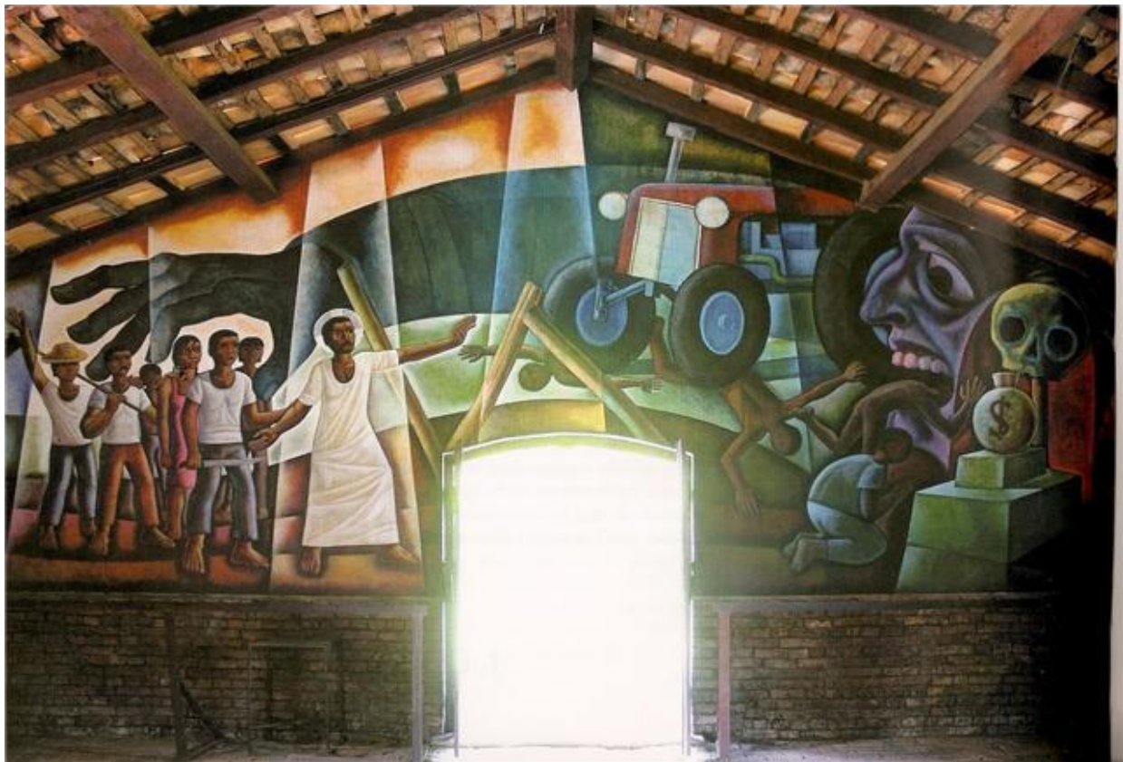
Mural da Libertação - O Reino e Anti-Reino. Na Igreja do Morro de Areia, em Santa Terezinha, 1989. Maximino Cerezo Barredo. In: CASALDÁLIGA, Pedro e BARREDO, Maximino Cerezo. Murais da Libertação na Prelazia de São Félix do Araguaia, Mato Grosso, Brasil . Fotografias: José María Concepción. São Paulo: Edições Loyola, 2005. p.10.

Essa pintura mural registra a visão da Igreja Católica acerca das relações entre empresas, projetos agropecuários, posseiros e indígenas no Nordeste de Mato Grosso durante o período militar. Sobre essas relações, assinale a afirmativa correta.