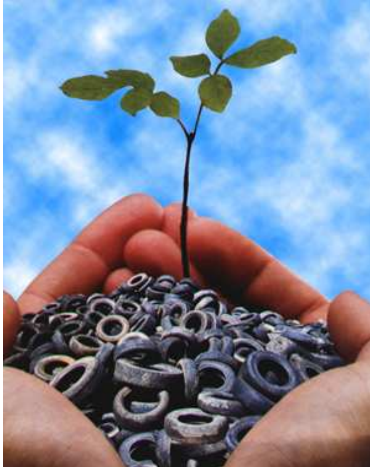
Imagem disponível em http://www.inkbrasil.com.br/sobreaink.html