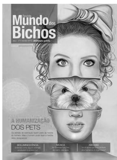
(Revista Mundo dos Bichos)

Com base na leitura dos seguintes textos motivadores e nos conhecimentos construídos ao longo de sua formação, redija texto dissertativo-argumentativo em modalidade escrita formal da língua portuguesa sobre o tema: A humanização de animais: limites.