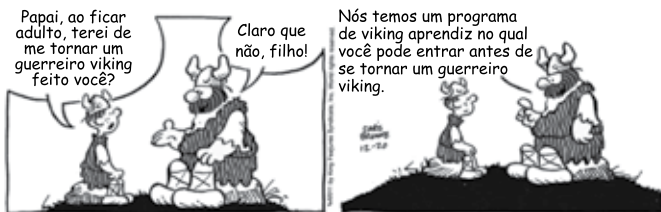
(Dik Browne, Folha de S.Paulo , 13.01.2013)

13. Leia a tira de Hagar, por Dik Browne.